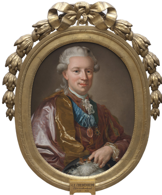
Carl Fredrik Fredenheim. Målning av okänd konstnär, efter Lorens Pasch d.y. Nationalmuseum, Stockholm. NMGrh 2314.

förvaras i Nationalmuseum, visar på ett hektiskt umgängesliv. Detsamma gör en annan handskrift av honom, i Kungliga biblioteket, med karaktär av biografiförberedande anteckningar för tiden fram till 1796 ( Conceptbiographi til 1796 ).