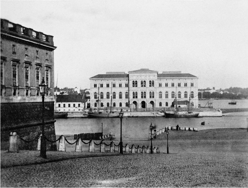
Nationalmuseum i Stockholm 1869.

hur dess inredning och installationer präglades av 1800-talets patriotiska nationalism, och om museets egentlige grundare Bror Emil Hildebrand, liksom om hans vän och samtida Christian Jürgensen Thomsen som byggde upp Nationalmuseet i Köpenhamn, blir det sagt att jämte en vetenskapssyn baserad på kronologi och utveckling bestod grundstenarna i deras vetenskapliga och museala arbete av rasforskning och nationalism. 3