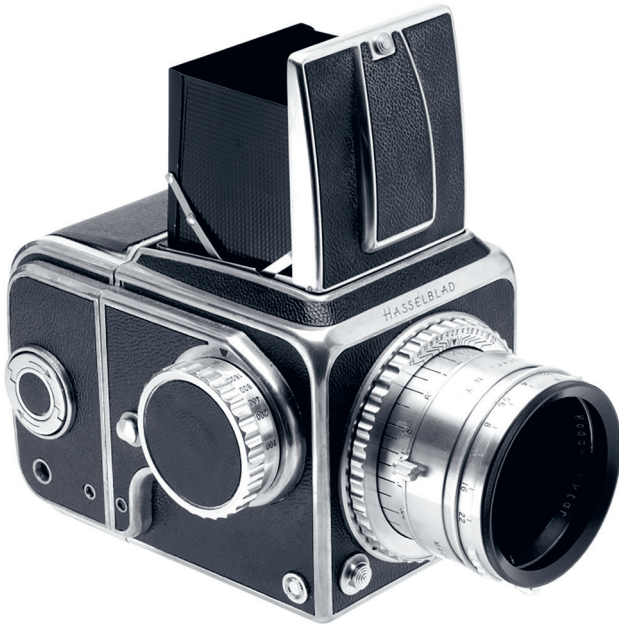
Hasselblad 1600F – Nr. 0001 började tillverkas 1948. Historien om Hasselblad är en del av Fotografihistorier . Foto: Jens Karlsson/Hasselbladsstiftelsens arkiv.

Boken omfattar hela fotografins historia, det vill säga från det tidiga 1800-talets första fotografiska experiment till samtidens digitala tekniker och gränssnitt. Dess fokus är fotografier, aktörer och tekniker i och från Sverige. Boken kombinerar ett kronologiskt och tematiskt upplägg. Fotografier har ända sedan 1800-talets början använts parallellt på en mängd olika sätt. Samtidigt finns det i varje tidsperiod vissa emblematiske användningsområden. Sådana periodiska förskjutningar, med olika så att säga fotografiska brännpunkter, är den ordnande principen